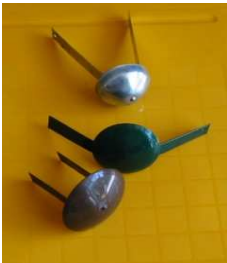
klobouček FeZn universal pro sloupek d=38-50 mm