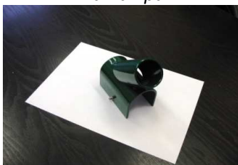
kotva vzpěry na PD